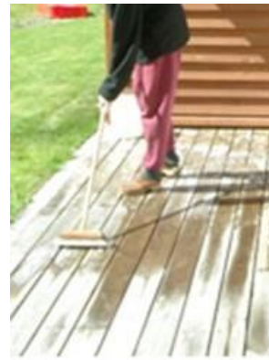
1.2: Brug Sioo:x Afrens for at rengøre overfladen før brug.