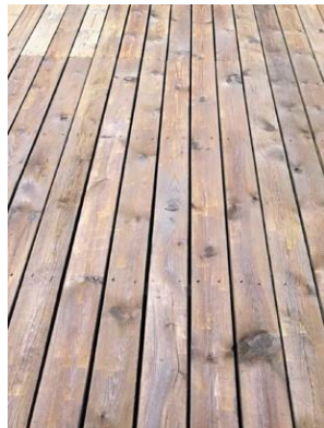
2.2: Sioo:x Træbeskyttelse Grunder påført.