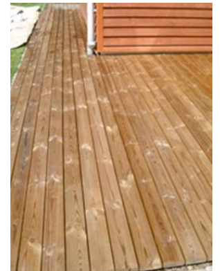
3.2: Den nyfærdigbehandlede overflade bliver i begyndelsen gul/brun. Ved senere kontakt med fugt, vil træet gradvist blive lysere.