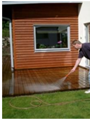
1.1: Gør overfladen våd.

I starten kan der fremkomme "ludlignende" hvide partikler. Det er overskudsvæske, der skylles bort i regn, eller det kan børstes væk, når overfladen er tør. Under den fugtige periode, efterår og vinter, lysner træ under tag betydeligt. Processen kan fremskyndes ved at spule vand på den behandlede overflade.