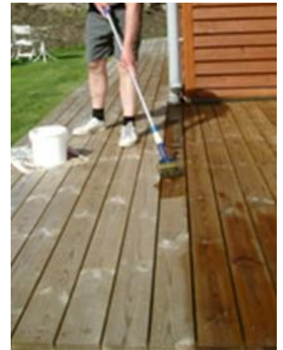
2.1: Efter træet er tørt, påføres Sioo:x Træbeskyttelse Grunder 2 gange.