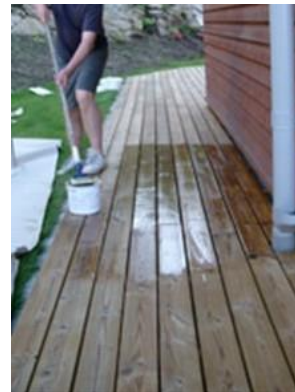
3.1: Når Sioo:x Træbeskyttelsen Grunder har tørret i mindst 4 timer, påføres Sioo:x Vejrbeskyttelse Færdigbehandling.